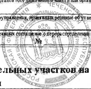
Схема расположения земельного участка или земельных участков на кадастровом плане территории